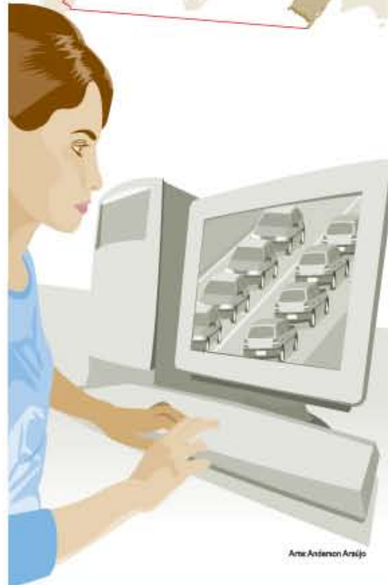
Arte: Antenor Araújo