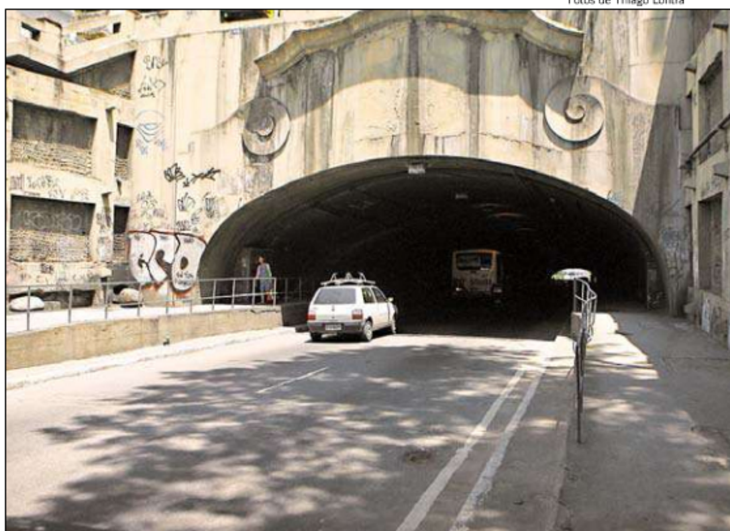
■ UMA DAS plataformas por onde passam pedestres será transformada em ciclovia, com piso especial

‘TÚNEL TERÁ RAMPAS DE ACESSO’, na página 8