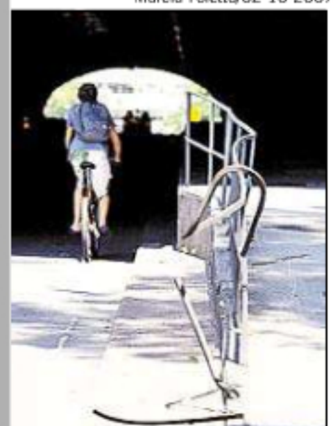
■ CORRIMÃO QUEBRADO: problemas de conservação