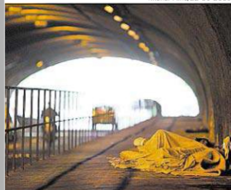
■ MORADORES de rua ocupam a passagem, usando-a como dormitório