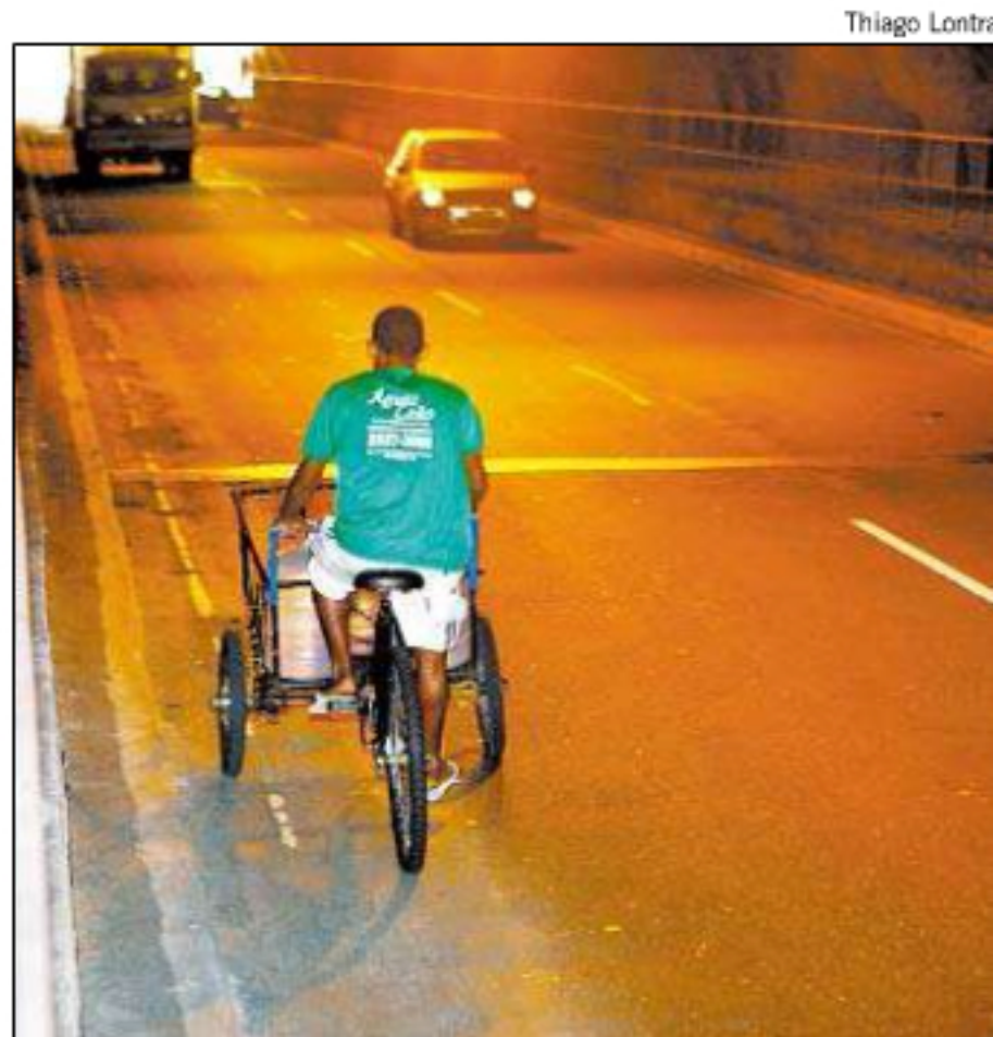
■ CICLISTA SE arrisca em trecho inferior, onde não há ciclovia

Lobo ressalta que um pedido da população em relação ao túnel é a melhoria da aces-