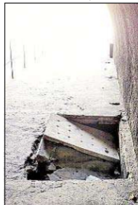
■ OBSTÁCULO NA passagem

— Com as UPPs no Tabajaras, Cabritos e Dona Marta, tenho ouvido pouco sobre assaltos e roubos ali atualmente. A passagem está mais segura